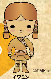
奈良県立橿原考古学研究所 マスコットキャラクター